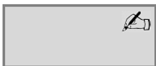
IL CONTRAENTE ADIGEST S.R.L.

Emesso in Budapest il 23/02/2018 in quattro esemplari